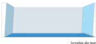
Le palais des jeux