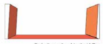
Une lumière aveugle assourdit et le cri de Hom