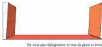
Un cri et une déflagration, le feu de glace se brise