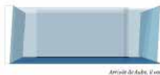
Arrivée de Asbi, il est