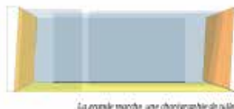
La grande marche, une chorégraphie de nulle